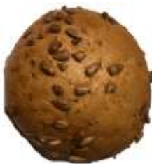
Sonnenblume 0,85 €