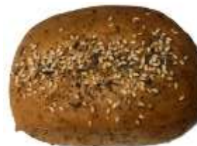
Kornknacker 0,85 €