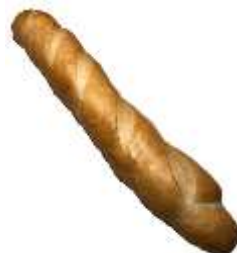
Baguette 3,20 €