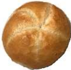
Kaisersemmel 0,60 €