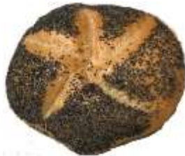
Mohnsemmel 0,70 €