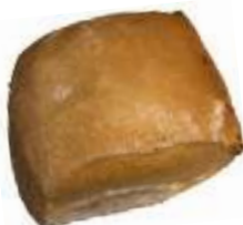
Ciabattasemmel 0,70 €