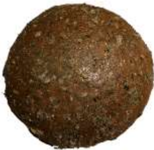
Kräuterkornbrot 500 g – 5,00 €