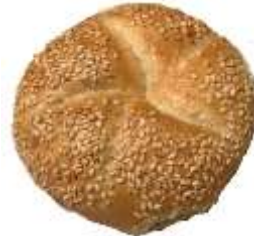
Sesamsemmel 0,70 €