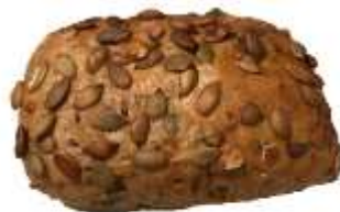
Kürbiskernsemmel 0,85 €