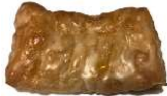
Apfeltasche 2,00 €