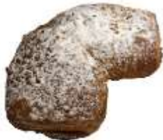
Streuselhörnchen 2,00 €