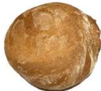
Krustenbrot 500 g – 3,00 € 750 g – 4,00 €