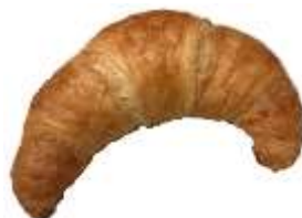
Croissant 0,70 €