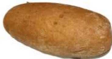
Mischbrot 500 g – 2,50 € 1000 g – 4,90 €