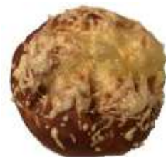
Käsesemmel 1,10 €