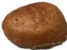
Dinkelsemmel 0,85 €