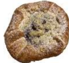
Plundergebäck 1,80 €