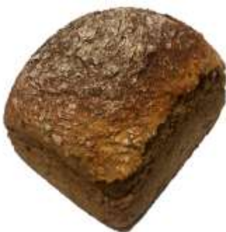
Dinkelbrot (Mo, Mi, Sa) 500 g – 5,00 €