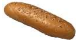
Salzspitz 0,70 €