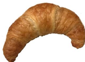
Croissant 2,00 €