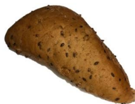
Erdnusssemmel 0,95 €