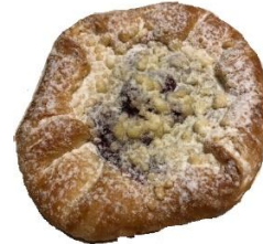
Plundergebäck 2,20 €