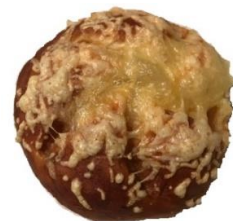
Käsesemmel 1,30 €