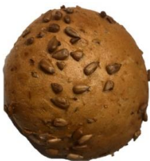
Sonnenblume 0,95 €