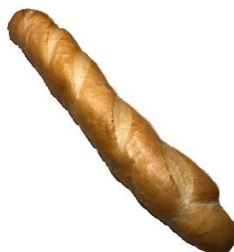
Baguette 3,50 €