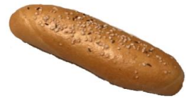
Salzspitz 0,85 €