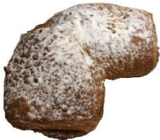
Streuselhörnchen 2,40 €