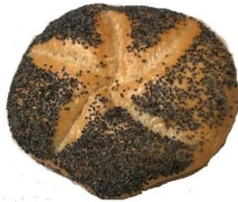
Mohnsemmel 0,85 €