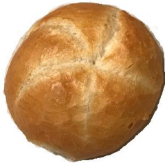
Kaisersemmel 0,70 €