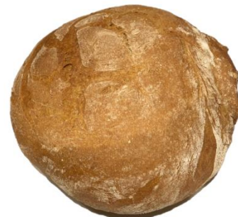
Krustenbrot 500 g – 3,50 € 750 g – 4,60 €