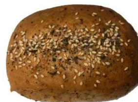
Kornknacker 0,95 €