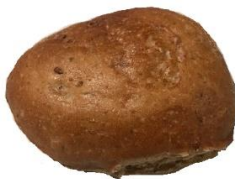
Dinkelsemmel 0,95 €