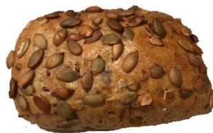
Kürbiskernsemmel 0,95 €