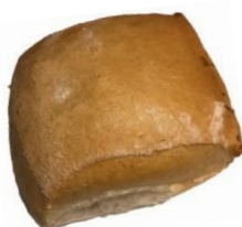
Ciabattasemmel 0,85 €