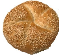
Sesamsemmel 0,85 €