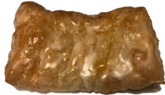
Apfeltasche 2,20 €