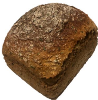
Dinkelbrot (Mo, Mi, Sa) 500 g – 6,10 €