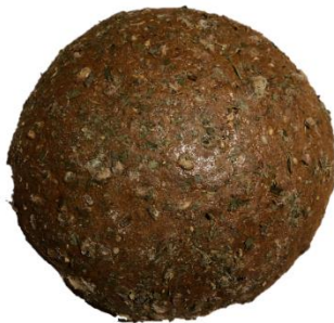
Kräuterkornbrot 500 g – 5,30 €